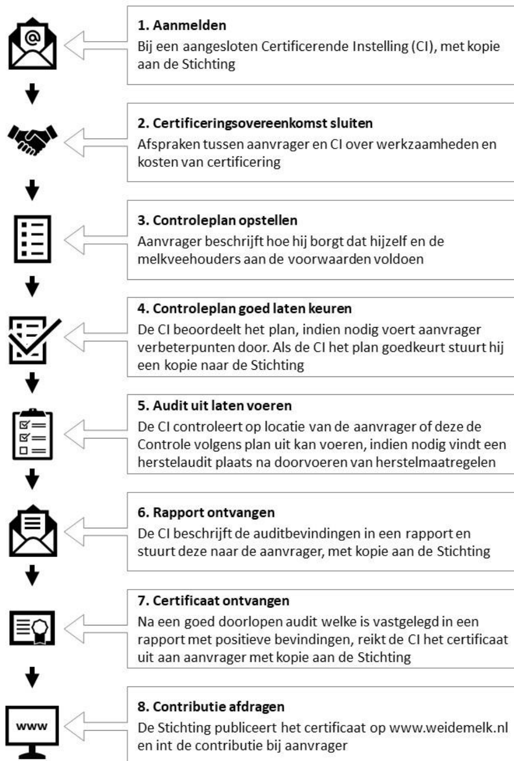
Figuur 2: Stappenplan voor certificering

In Figuur 2 staat schematisch uitgelegd welke stappen een bedrijf moeten doorlopen voordat er een Certificaat Weidegang uitgereikt kan worden.